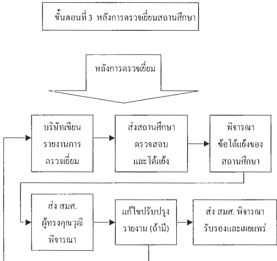
ภาพประกอบ 4 แผนภูมิแสดงหลังการตรวจเยี่ยมสถานศึกษา

เมื่อเสร็จภารกิจในการตรวจเยี่ยมสถานศึกษาแล้ว คณะผู้ประเมินภายนอกจะต้องร่วมกันทำร่างรายงานผลการประเมินสถานศึกษา โดยนำข้อมูลทั้งหมดมาเขียนให้ตรงตามหลักฐานข้อมูลต่าง ๆ ที่รวบรวมได้ และตรงตามที่รายงานให้สถานศึกษาทราบด้วยวาจา ไม่ใช่จากความรู้สึกรหรือความคิดเป็นส่วนตัวของผู้ประเมินแล้วจัดให้สถานศึกษาตรวจสอบและโต้แย้งภายใน 15 วัน นับจากวันที่ได้รับร่างรายงานผลการประเมิน ผู้ประเมินพิจารณาแล้วอาจมีการปรับปรุงแก้ไขหรือยืนยันตามรายงานแล้วแต่กรณี เมื่อเสร็จสิ้นขั้นตอนนี้แล้วจึงนำเสนอต่อสำนักงานเพื่อให้ผู้ทรงคุณวุฒิที่ได้รับการแต่งตั้งจากสำนักงานพิจารณาความถูกต้อง ทัศนคติ กรอบกลุ่มสาระที่