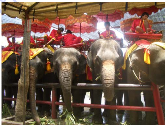
ภาพประกอบ 31 การพักผ่อนของควาญช้างเมื่อว่างจากการรับนักท่องเที่ยว

ควาญช้างส่วนมากจะอยู่กับช้าง ระหว่างที่รอบริการนักท่องเที่ยว ควาญช้างสามารถไปในบริเวณวังช้างอยุธยาฯ ห้ามออกนอกสถานที่ ต้องขออนุญาต ช้างต้องมีคนดูแลเมื่อไปไหนต้องถือช้างกับราวผูกไว้ การพักผ่อนของควาญช้างวัยรุ่นไม่มีครอบครัว ส่วนมากจะฟังเพลงจากโทรศัพท์พูดคุยโทรศัพท์ นั่งคุยกับเพื่อนควาญชื่อขนมขบเคี้ยวมารับประทานที่ศาลาทรงไทยริมน้ำ ควาญบางคนนอนหลับบนแหงช้าง