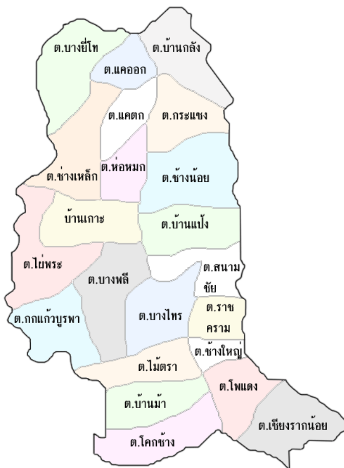
ภาพประกอบที่ 3 แผนที่อำเภอบางไทร จังหวัดพระนครศรีอยุธยา