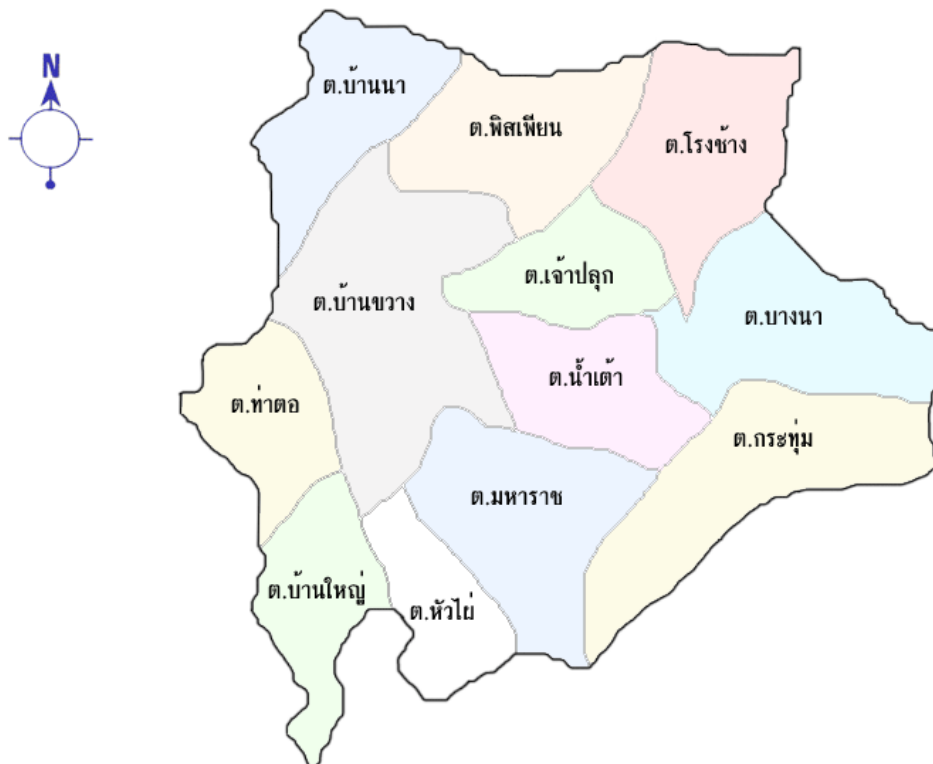
ภาพประกอบที่ 4 แผนที่อำเภอหรรษา จังหวัดพระนครศรีอยุธยา