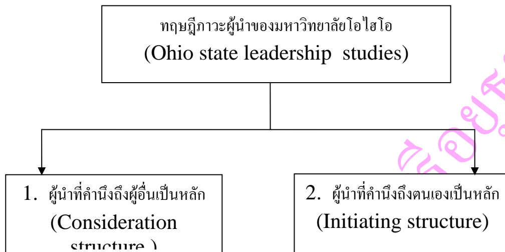
ภาพประกอบ 3 ลักษณะพฤติกรรมของภาวะผู้นำของมหาวิทยาลัยโอไฮโอ

ที่มา : ศิริวรรณ เสรีรัตน์ และคณะ. 2541 : 198