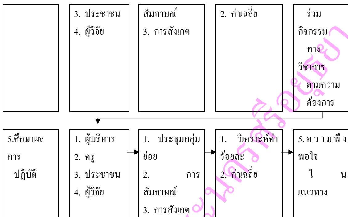
ภาพประกอบ 5 ขั้นตอนการวิจัยเชิงปฏิบัติการแบบมีส่วนร่วม