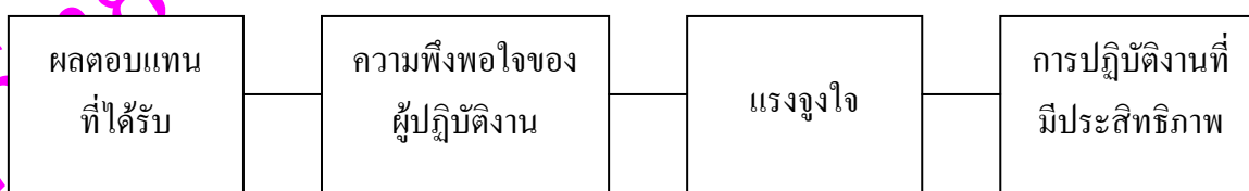
ภาพประกอบ 3 ความพึงพอใจนำไปสู่การปฏิบัติงานที่มีประสิทธิภาพ

สมยศ นาวิการ (2525 : 155) กล่าวว่า iva การตอบสนองความต้องการผู้ปฏิบัติงานจนเกิดความพึงพอใจ จะทำให้เกิดแรงจูงใจในการเพิ่มประสิทธิภาพการทำงานที่สูงกว่าผู้ที่ไม่ได้รับการตอบสนอง ที่เสนอตามแนวคิดดังกล่าว สามารถแสดงดังภาพประกอบ 3