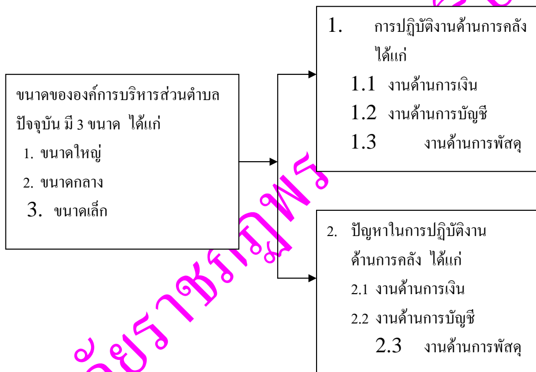
ภาพประกอบ 1 กรอบแนวคิดในการวิจัย