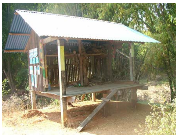
ภาพประกอบ 3 ศาลปะกำของชาวบ้านค่ายจังหวัดชัยภูมิ

วัฒนธรรมการเลี้ยงช้างของชาวบ้านค่ายหมื่นแผ้วมีความเชื่อเกี่ยวกับผีปะกำคือเป็นผีบรรพบุรุษที่เป็นวิญญาณศักดิ์สิทธิ์สิงสถิตอยู่ในเชือกที่ใช้สำหรับในการคล้องช้าง ดังนั้นกลุ่มคนเลี้ยงช้างจะมีความเชื่อดังกล่าว จะมีการสร้างศาลปะกำเอาไว้เก็บเชือก หรือบ่วงบาศที่ใช้สำหรับคล้องช้าง โดยจะสร้างแยกออกจากตัวบ้านต่างหาก และจะมีการเซ่นไหว้ในช่วงที่มีการออกไปคล้องช้าง หรือมีการเดินทางนำช้างออกไปพื้นที่อื่น ในกรณีที่มีการสมรสหรือครองเรือนคนที่นับถือผีปะกำก็ต้องบอกกล่าว ดังนั้นการถือปะกำนั้น ทุกครอบครัวที่มีการเลี้ยงช้างก็จะมีความเชื่อดังกล่าวคล้ายคลึงกัน