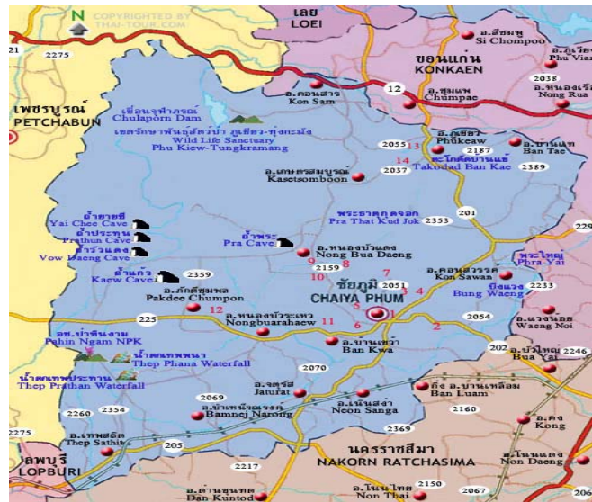
ภาพประกอบ 2 แผนที่จังหวัดชัยภูมิ