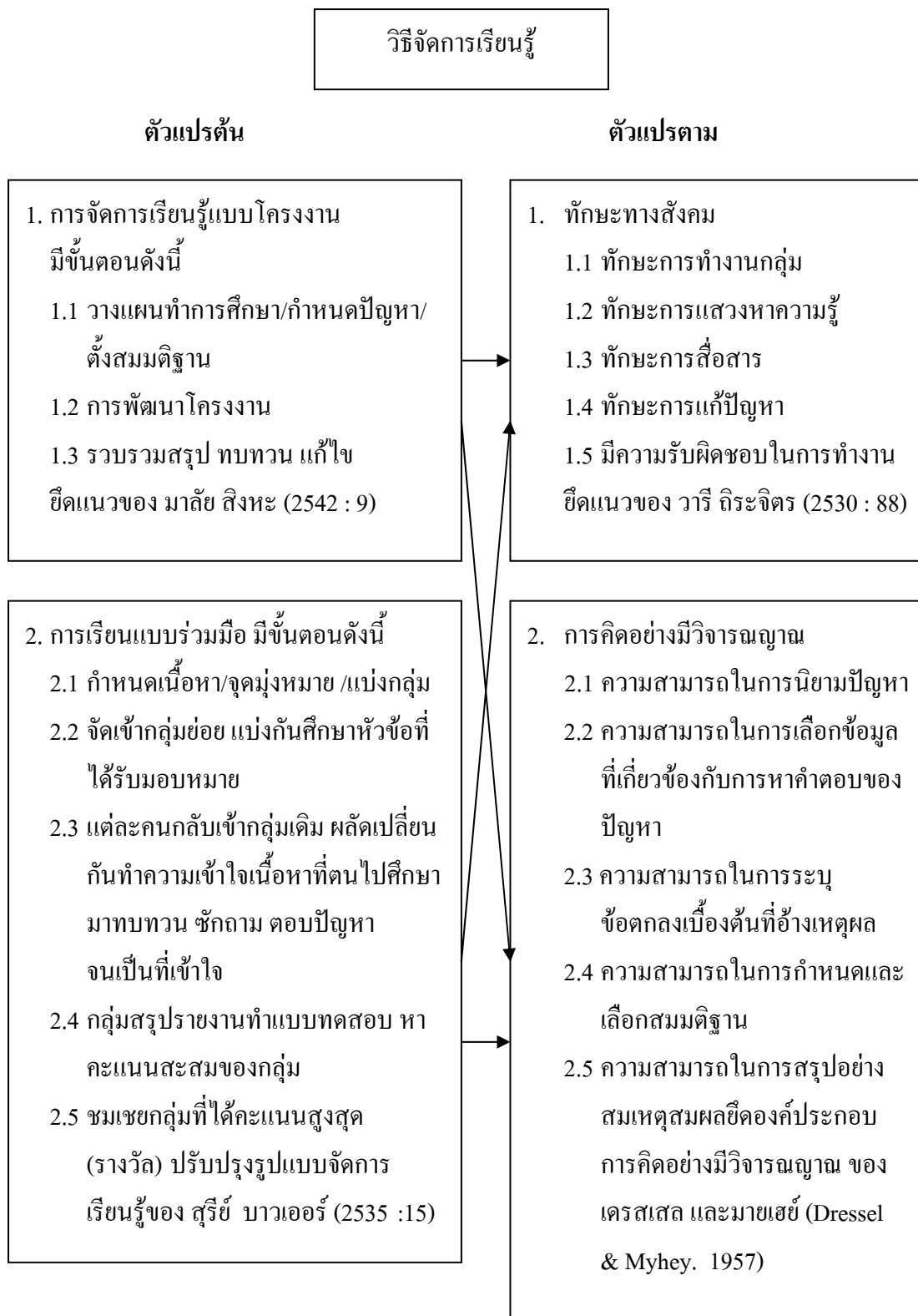
ภาพประกอบ 1 แสดงกรอบแนวคิดในการวิจัย