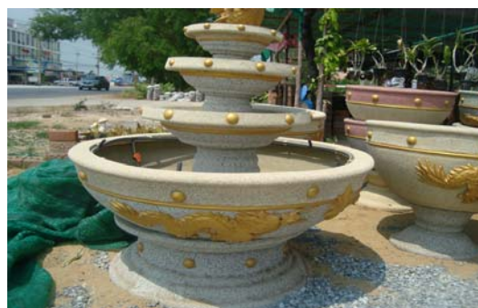
ภาพ 44 แจกันทรงสูงคลาสสิก