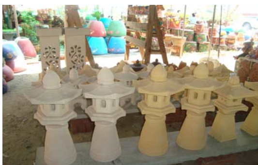
ภาพ 43 กระถางบัว/กระถางต้นไม้