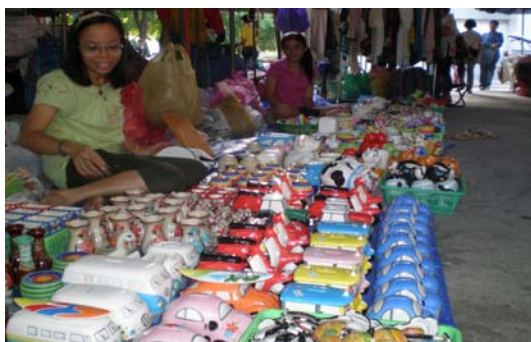
ภาพ 33 เครื่องประดับดินเผา/สร้อยคอ กำไลข้อมือ