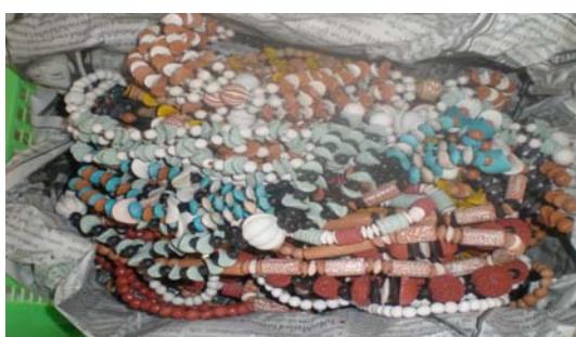
ภาพ 31 การบรรจุหีบห่อผลิตภัณฑ์เพื่อให้สินค้าควมมี มูลค่าที่สูงขึ้น