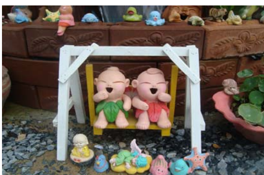
ภาพ 7 ตุ๊กตาดินเผาประยุกต์