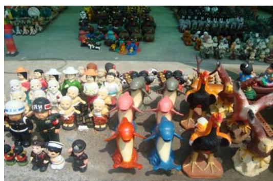
ภาพ 8 ตุ๊กตาดินเผากระบะแบบและกะละสี