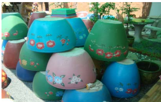
ภาพ 41 ดอกไม้หินทรายติดฝาผนัง