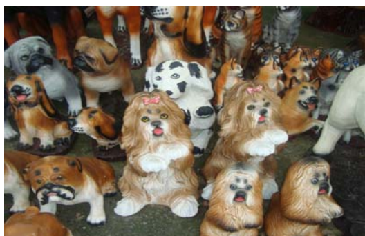
ภาพ 26 กลุ่มภาพแจกันดินเผาขนาดกลาง (2)