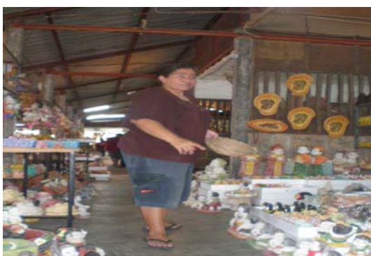
ภาพ 19 ลูกค้าที่มาซื้อสามารถเลือกได้ตลอดทั้งร้าน