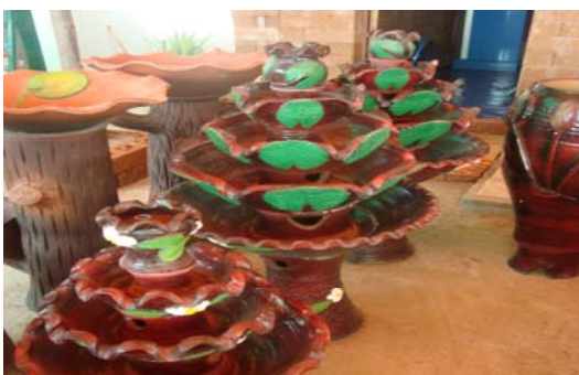
ภาพ 22 กลุ่มน้ำสั่นชนิดชั้น ตกแต่งด้วยใบบัว