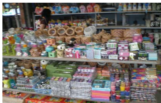
ภาพ 4 สินค้าดินเผาที่ผ่านการแปรรูปหลากชนิด