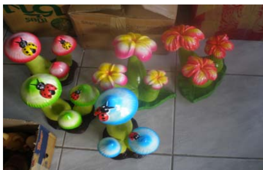
ภาพ 28 ตุ๊กตาปูนผสมรูปปั้นสัตว์