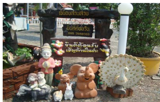
ภาพ 36 การนำกลุ่มสินค้าออกจำหน่ายตามร้านค้าเช่า ทั่วไป (2)