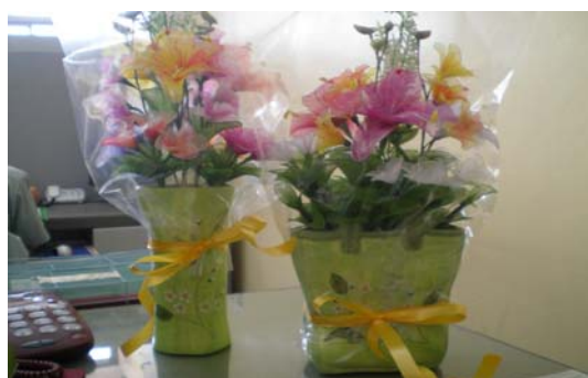
ภาพ 11 โมบายแขวนประดับบ้าน