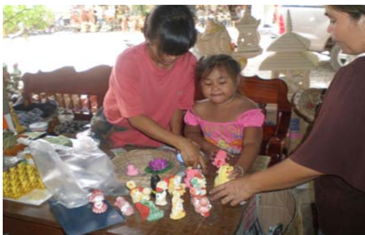
ภาพ 12 โคมไฟดินเผา