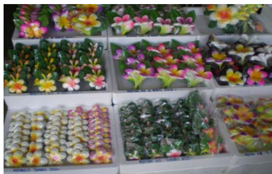
ภาพ 13 การประยุกต์สินค้าโดยการตกแต่งเพื่อให้มีราคาสูงขึ้น