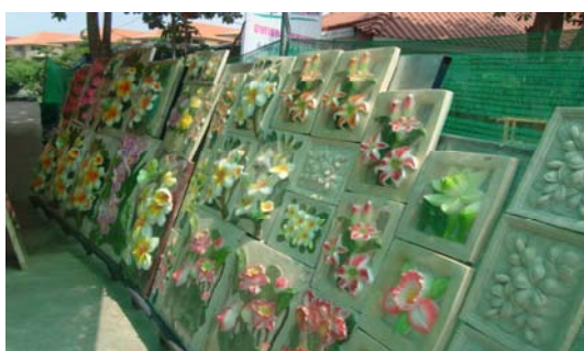
ภาพ 39 น้ำพุพร้อมกระถางบัว