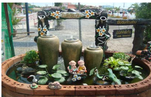
ภาพ 35 การนำกลุ่มสินค้าออกจำหน่ายตามร้านค้าเช่า ทั่วไป (1)