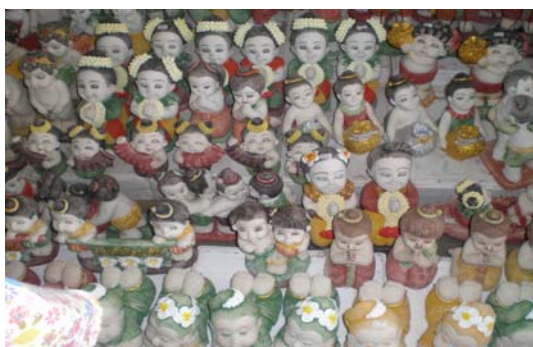
ภาพ 5 ตุ๊กตาดินเผาปูนผสมรูปคน