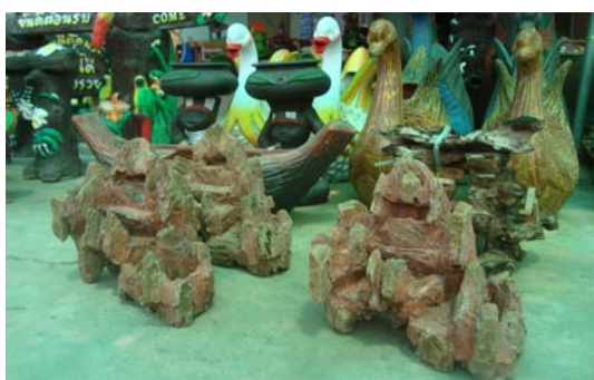
ภาพ 45 โคมไฟหินทราย