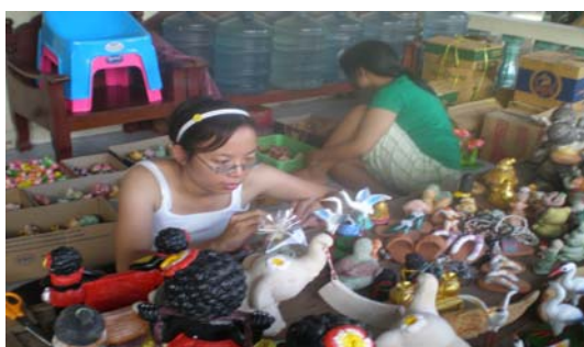
ภาพ 29 การประกอบส่วนต่างๆ ของสินค้าก่อน ออกจำหน่าย