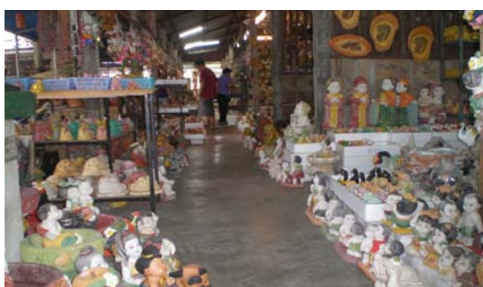
ภาพ 15 ดอกไม้ดินประดับศิลปะแบบ