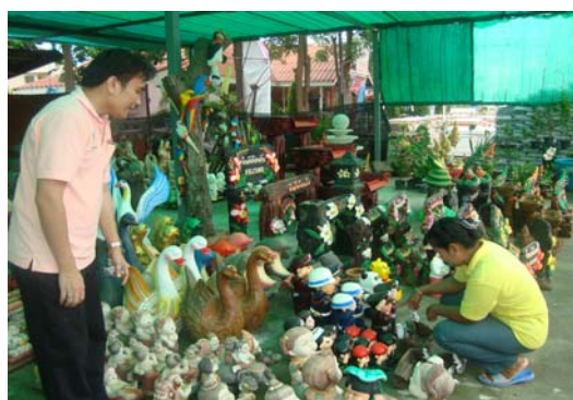
ภาพ 20 การแนะนำสินค้ากลุ่มดินเผาให้กับลูกค้า