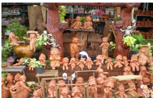
ภาพ 3 ตุ๊กตาดินเผาไม่ลงสี