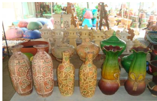
ภาพ 42 กลุ่มตุ๊กตารูปสัตว์