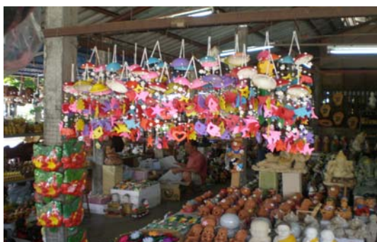
ภาพ 9 เครื่องประดับตกแต่งสวนในกลุ่มดินทราย