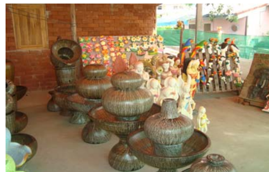
ภาพ 38 สถานที่จำหน่ายหน้าร้านของแต่ละร้าน