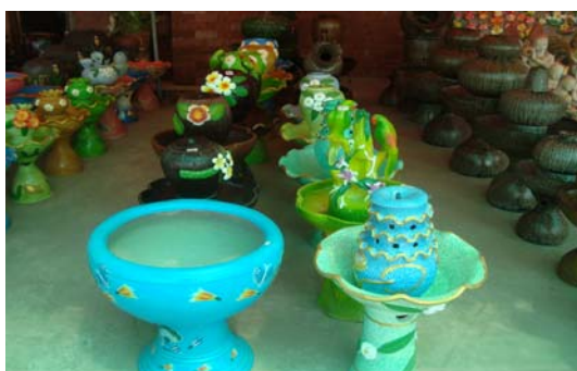
ภาพ 37 ตัวอย่างการตกแต่งสถานที่ต่างๆ ด้วยอิฐแดง