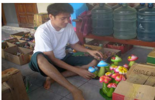
ภาพ 27 การตกแต่งและบรรจุหีบห่อ