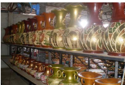
ภาพ 24 กลุ่มแจกันขนาดใหญ่ (2)