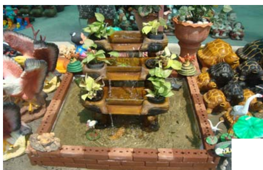
ภาพ 46 น้ำพุหินทราย