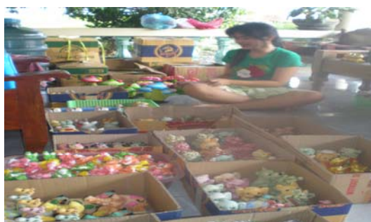
ภาพ 30 การจัดตกแต่งหีบห่อ เพื่อนำออกตกแต่งสวน