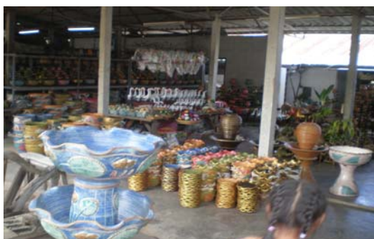
ภาพ 21 อ่างบัวทรงธรรมดา และกระถางต้นไม้สำเร็จรูป