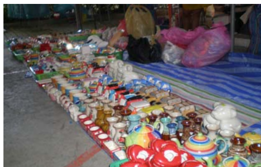
ภาพ 34 เต้านำโชคดินเผาสีเงิน และสีทอง