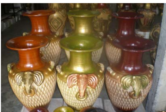
ภาพ 23 กลุ่มแจกันขนาดใหญ่ (1)