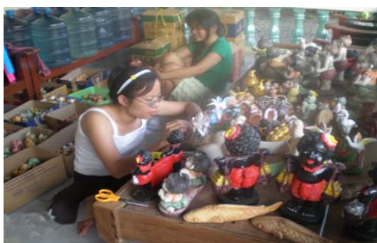
ภาพ 25 กลุ่มภาพแจกันดินเผาขนาดกลาง (1)