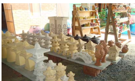
ภาพ 7 ตุ๊กตาดินเผาประยุกต์