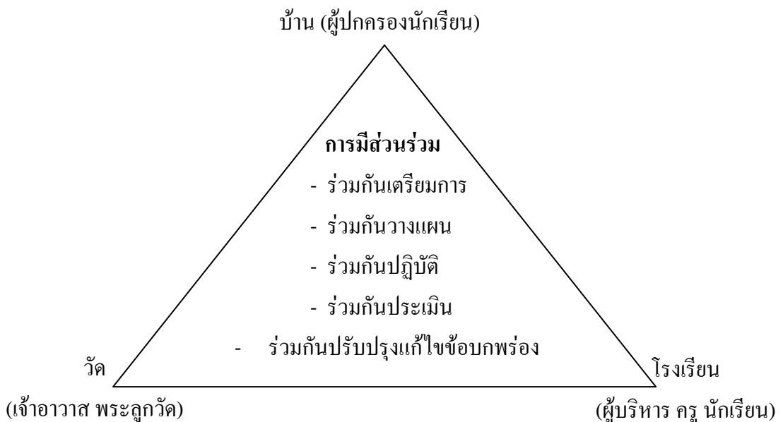
ภาพประกอบ 3 ความสัมพันธ์ของการมีส่วนร่วม บ้าน วัด โรงเรียน

กิติมาน นาทอง (2546 : 6-31) ได้กล่าวว่า การจัดการศึกษาในอนาคตจึงไม่เป็นหน้าที่ของโรงเรียนแต่เพียงฝ่ายเดียวอีกต่อไป แต่ต้องร่วมกันกันจัดการศึกษากับผู้มีส่วนได้ส่วนเสียในการจัดการศึกษาทุกๆ ฝ่าย และการร่วมกัน จัดทำกิจกรรมนักเรียนในด้านต่างๆ โดยความร่วมมือของบ้าน วัดและโรงเรียน จึงน่าจะเป็นอีกแนวทางหนึ่งที่จะทำให้ปัญหาของการจัดการศึกษาลดลง ดังภาพประกอบ 3