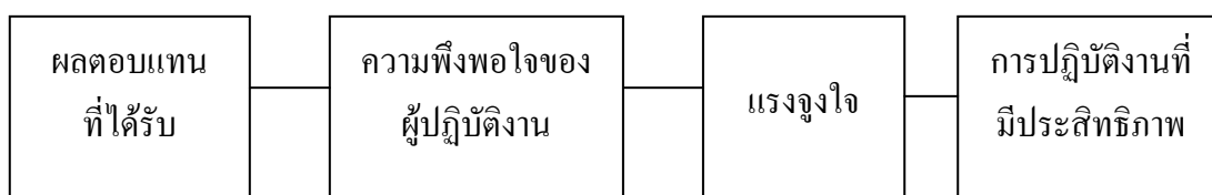
ภาพประกอบ 4 ความพึงพอใจนำไปสู่การปฏิบัติงานที่มีประสิทธิภาพ

สมยศ นาวิการ (2525 : 155) กล่าวว่า iva การตอบสนองความต้องการผู้ปฏิบัติงานจนเกิดความพึงพอใจ จะทำให้เกิดแรงจูงใจในการเพิ่มประสิทธิภาพการทำงานที่สูงกว่าผู้ที่ไม่ได้รับการตอบสนอง ทิศนะตามแนวคิดดังกล่าว สามารถแสดงดังภาพประกอบ 4