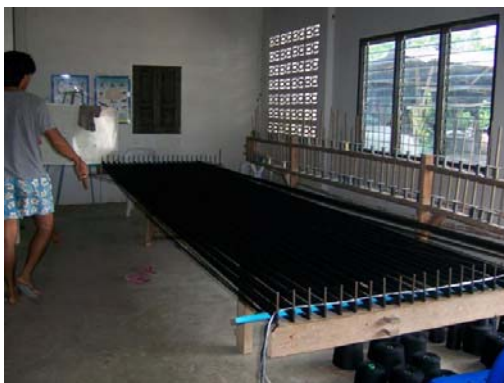
การขึ้นเครื่องด้าย

2.2 การคั่นหมี่เป็นลำ ทำโดยนำด้ายม้วนสำเร็จที่ซื้อมา มาคั่นทีละเส้นสลัดเป็นจุดโดยมีเครื่องมือช่วยคั่น ปัจจุบันใช้กันทั้งเครื่องมือช่วยคั่นแบบดั้งเดิมซึ่งใช้แรงงานคนโยกเครื่องคั่นและแบบสมัยใหม่ที่ใช้มอเตอร์หมุนเครื่องคั่น ซึ่งการคั่นนี้สามารถคั่นได้ 7,14,17,21,25,31,41,51 และ 61 ลำตามที่ต้องการ ถ้าจำนวนลำน้อยจะมัดลายได้ไม่ละเอียดนักและได้สีน้อย ส่วนมากจะมัดลายกันตั้งแต่ 25 ลำขึ้นไปจึงจะมัดลายได้ละเอียด สามารถเลือกใช้สีได้หลากหลาย สามารถประดิษฐ์ตัดแปลงได้ตามต้องการ ในกรณีผ้าไหมลายราตรีวังนารายณ์ จะคั่นหมี่ จำนวน 271 ลำ 20 ชิน (คู่) จะได้ผ้า 4 เมตร