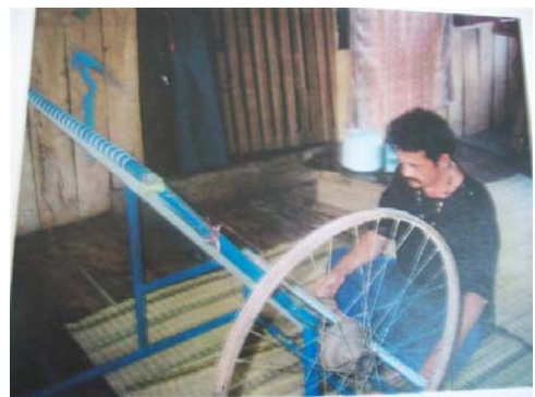
การคั่นหมี่เป็นลำ