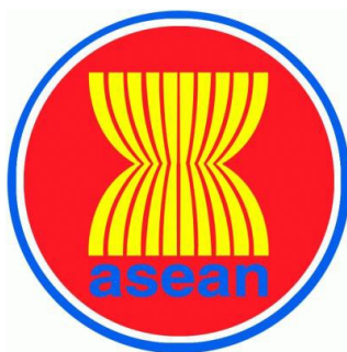
ภาพประกอบ 2 สัญลักษณ์อาเซียน