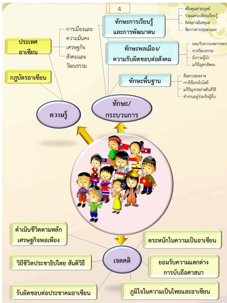
ภาพประกอบ 3 คุณลักษณะของเด็กไทยในประชาคมอาเซียน

มหาวิทยาลัย และหน่วยงานต่าง ๆ เช่น สถานทูต มหาวิทยาลัยภาครัฐและเอกชน ในการร่วมกำหนดคุณลักษณะเด็กไทยในประชาคมอาเซียน (สำนักงานคณะกรรมการการศึกษาขั้นพื้นฐาน, 2554, หน้า 5) แสดงดังภาพประกอบ 3