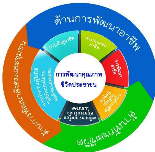
ภาพประกอบ 2 กรอบการจัดการศึกษาต่อเนื่อง