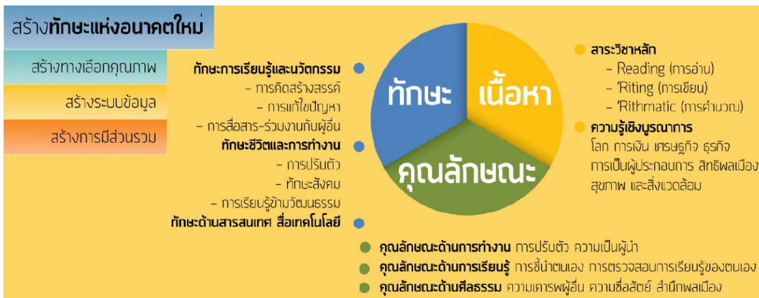
ภาพประกอบ 3 ทักษะแห่งอนาคตใหม่